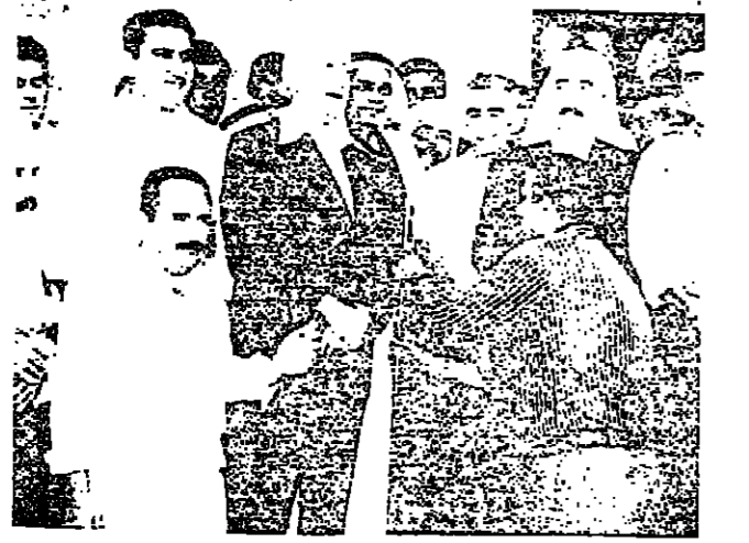
حفلة افتتاح « بزار » في السوق السياحي في القرية برعاية وزير السياحة السابق السيد موشيه كول ورئيس المجلس المحلي الشيخ نواف الحلبي

وقد ناقش السيد حسون مع خطيب العديد من القضايا المتعلقة بالبلدية والمجتمع المحلي ، وبحثوا في سبل تطوير الخدمات المقدمة للمواطنين ، واهتموا بشكل خاص بالمشاكل التي تواجهها البلديات الصغيرة ، وبحثوا في سبل تحسين الخدمات المقدمة للمواطنين ، واهتموا بشكل خاص بالمشاكل التي تواجهها البلديات الصغيرة ..